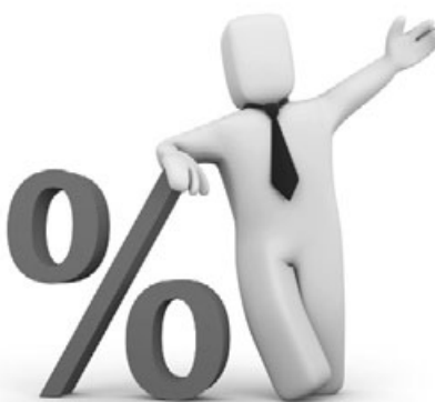
Рис. из сети интернет

Межрайонная ИФНС России № 3 по РК в Ухте