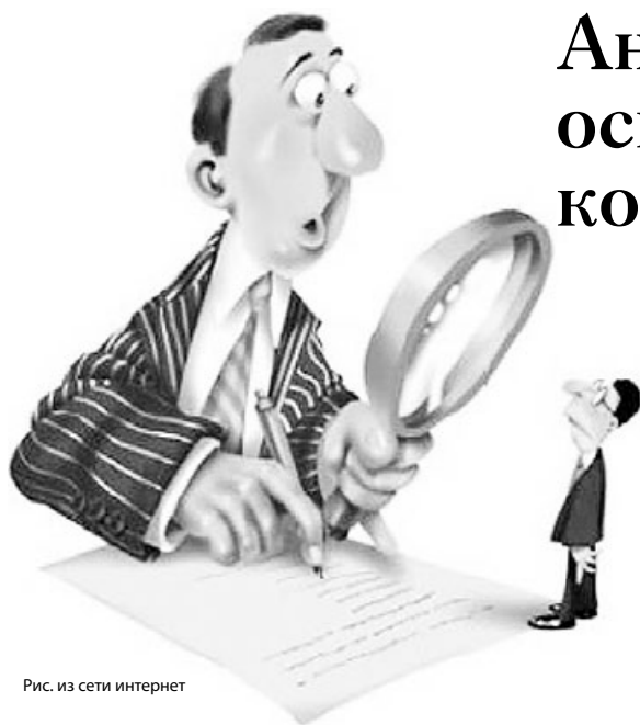
Рис. из сети интернет